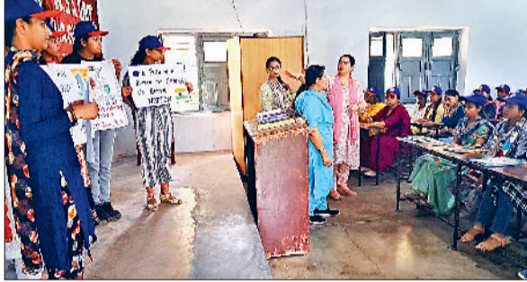
अंबाला। पोस्टर के जरिए मतदान को लेकर जागरूक करती छात्राएं।