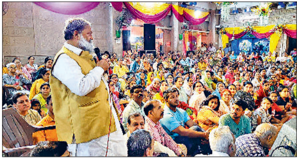
अंबाला। कथा में श्रद्धालुओं को संबोधित करते पूर्व मंत्री अनिल विज।

पूर्व गृहमंत्री अनिल विज ने कहा कि 'जो लोग कहते हैं कि श्रीराम और श्रीकृष्ण काल्पनिक हैं उनका जवाब दिया जाने वाला है। यही हमारे पथ प्रदर्शक हैं, यह हमें रास्ता दिखाते हैं और यह हमारे लाइट हाउस हैं। विज शुक्रवार को यहां श्री बांके बिहारी मंदिर गोविंद नगर में चल रही 50वें स्वर्णिम वार्षिक उत्सव श्रीमद्भागवत कथा में उपस्थित श्रद्धालुओं को संबोधित कर रहे थे। उन्होंने कहा कि स्वामी यहां आए हैं और इन्होंने बहुत ही अच्छे ढंग से