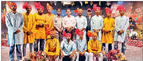
अंबाला। दूरदर्शन पर शानदार आर्केस्ट्रा प्रस्तुत करने वाले छात्र।