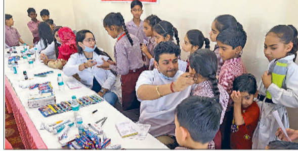
कुरुक्षेत्र। बच्चों के दांतों का चेकअप करते चिकित्सक।