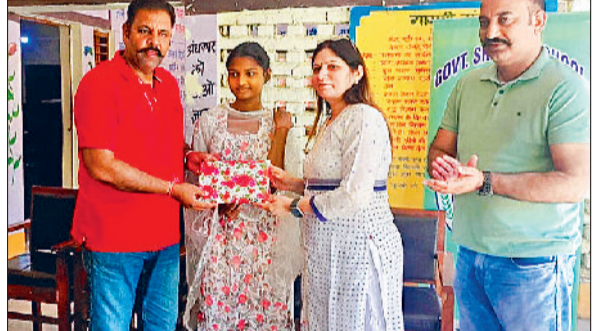
बराड़ा। परीक्षा में बेहतर प्रदर्शन करने वालों को सम्मानित करते हुए मुख्यातिथि।

पास घर-घर जाकर मतदान के प्रति जागरूकता फैलाने का कार्य किया। इस कार्यक्रम में स्वयंसेविकाओं ने बटुचढ़ कर भाग लिया। लगभग 100 स्वयंसेविकाओं ने भाग लिया।