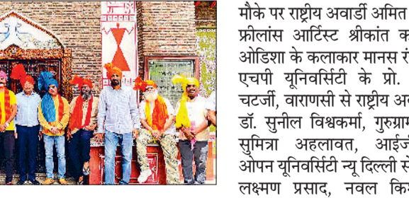
कुरुक्षेत्र। कुवि के धरोहर हरियाणा संग्रहालय का अवलोकन करते भारत के प्रतिष्ठित कलाकार।

कुरुक्षेत्र विश्वविद्यालय के युवा एवं सांस्कृतिक कार्यक्रम विभाग द्वारा आयोजित चार दिवसीय कार्यशाला के दूसरे दिन विद्यार्थियों को कार्यशाला में विभिन्न कला से संबंधित बारीकियों की जानकारी देने आए देशभर के 10 राष्ट्रीय ख्याति प्राप्त कलाकारों ने आज स्थानीय धरोहर हरियाणा संग्रहालय का अवलोकन किया। सभी कलाकारों का विधिवत रूप से पगड़ी बांधकर स्वागत किया गया और धरोहर हरियाणा संग्रहालय में स्थापित हरियाणवी लोक संस्कृति के विषय में जानकारी दी गई।