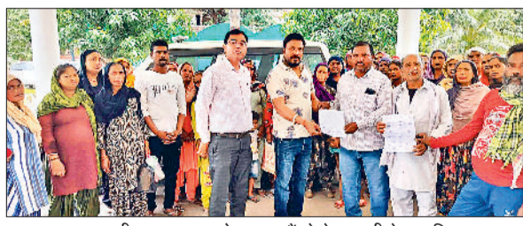
नारायणगढ़। एसडीएम सहायक को ज्ञापन सौंपते देहा बस्ती के नागरिक।

जाँद। भिवानी रोड तथा रोहतक रोड के बीच फ्लाइंग ओवर के नीचे एक व्यक्ति का शव बरामद हुआ है। मृतक के पास से ऐसा कुछ नहीं मिला है जिससे उसकी शिनाख्त हो सके। आशंका जताई जा रही है कि व्यक्ति ट्रेन की चपेट में आया है। मृतक की पहचान न हो पाने के चलते शव को नागरिक अस्पताल के शव गृह में रखवाया गया है। मृतक की कलाई पर अंग्रेजी में आरके लिखा हुआ है। राजकीय रेलवे पुलिस मामले की जांच कर रही है। वीरवार रात को पुलिस को सूचना मिली कि भिवानी रोड से रोहतक रोड के बीच फ्लाइंग ओवर के नीचे रेलवे लाइन के पास एक व्यक्ति का शव पड़ा हुआ है।